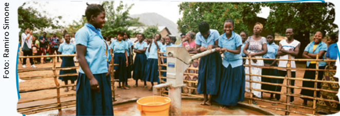
In Mosambik konnten mit den Spendenweiterleitungen unter anderem Pumpbrunnen und Toiletten rehabilitiert werden.

Rund CHF 1'034'000 wurden für unsere WASH-Projekte inklusive Projektbegleitkosten eingesetzt, mit Fokus auf Zugang zu Trinkwasser, sanitären Anlagen sowie Bildungsarbeit zum Thema Hygiene. Somit wurden 73 Prozent aller eingesetzten Mittel für die Realisierung der Auslandsprojekte verwendet. Insgesamt konnten 10 WASH-Projekte in den 8 Ländern Südafrika, Tansania, Uganda, Nepal, Äthiopien, Madagaskar, Mosambik und Burkina Faso realisiert werden.