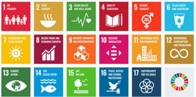
Die Sustainable Development Goals (SDG) wurden im Jahr 2015 von allen UNO-Mitgliedstaaten verabschiedet mit der Ambition, die Ziele gemeinsam bis 2030 zu erreichen.

Die Ausgaben für Kommunikation und Öffentlichkeitsarbeit umfassen alle analogen und digitalen Massnahmen zur Gewinnung und Betreuung der Spender:innen sowie die Herstellungskosten von Kommunikationsmaterialien. Hinzu kommt der Verwaltungsaufwand, welcher durch die Aufgaben im Back Office, IT, Rechts- und Beratungskosten sowie zur Organisationsweiterentwicklung entsteht. 2024 waren dies total 20 Prozent der Gesamtaufwände. Solche Investitionen sind wichtig, um langfristig handlungsfähig zu bleiben: Sie ermöglichen eine effiziente Organisation, die Gewinnung neuer Unterstützer:innen und die Sicherstellung, dass Spenden wirksam und nachhaltig eingesetzt werden.